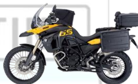
BMW F 800 GS / ADVENTURE