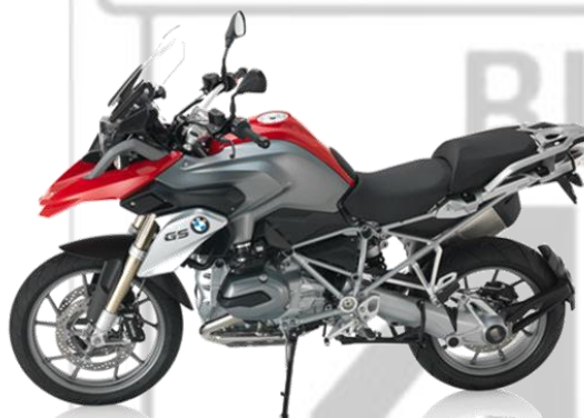
BMW R 1200 GS LC