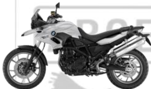
BMW 700 GS