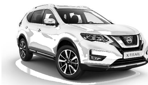
Nissan Xtrail - 2.5l Essence

Nous pensons que quelques passagères ou certains pilotes ne souhaiteront pas entreprendre ce voyage en duo sur une moto, notamment sur les portions de pistes. Nous avons prévu la possibilité de louer des véhicules SUV 4x4 que ces dames (ou famille et amis ne possédant pas le permis motos et désirant se joindre au groupe) pourront conduire. Voici les conditions que nous pouvons proposer pour cette option :