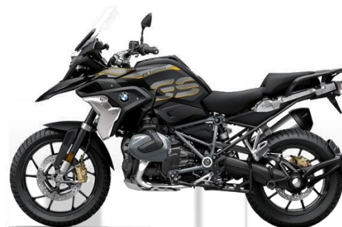
BMW R 1250 GS LC