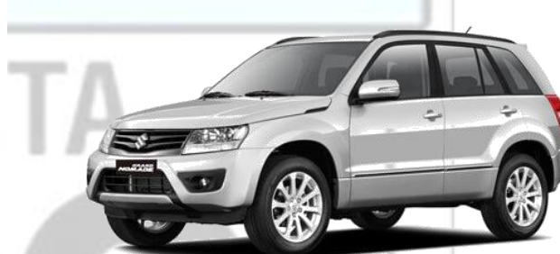
Suzuki Grande Nomade - 2.4l Essence